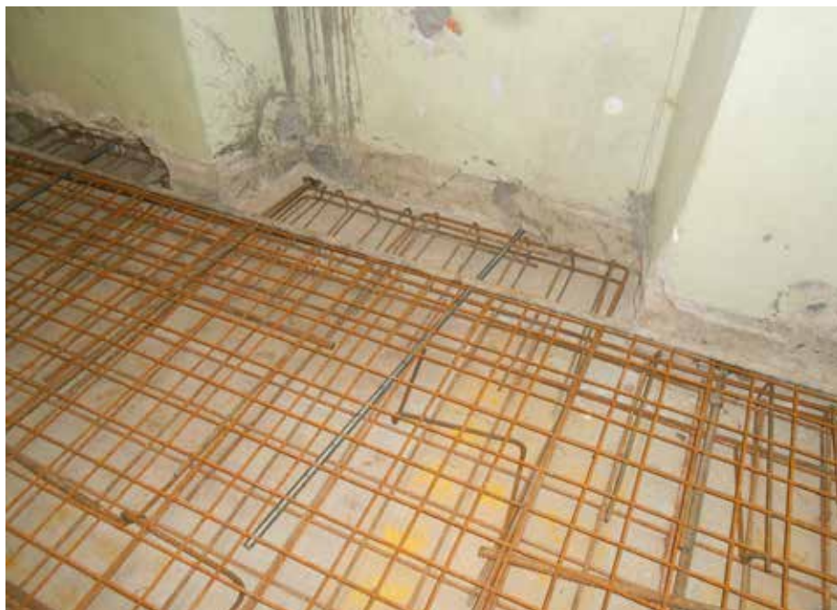
Slika št. 5: Fotografija armature armiranobetonske plošče z vidnimi ležiščnimi utori ter notranjim delom kemijskih in klasičnih fasadnih jeklenih sider.

Odkop in tesnjenje obodnih temeljnih zidov pod koto terena iz zunanje strani vsled lokacije hiše nista bila izvedljiva. Posledično seveda ni bila možna popolna kontrola nad debelino zidov in iztekanjem injekcijske mase v zaledje. V tem delu je bila zato poraba cementa krepko čez 80 kg/m 3 zidovja. V višjih nadzemnih etažah je bila poraba nižja, v povprečju 70 kg/m 3 zidovja. Poraba je bila glede na dokaj homogeno sestavo zidov zmerno visoka. Pri izvedbi injektiranja smo poleg jemanja vzorcev za laboratorijske preizkuse materialno tehničnih karakteristik injekcijske mase po posameznih etažah kronsko od-