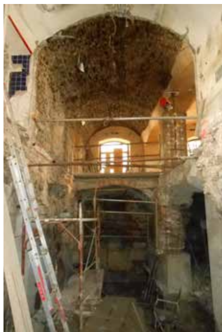
Slika št. 7: Fotografija izvedbene faze; v spodnjem kletnem delu vidne armiranobetonske kampade podbetoniranja, na sredi višine razpiranje zidov pred izvedbo polja armiranobetonske plošče, v zgornjem delu viden ohranjen kamniti obok.

Kot že omenjeno, je imela stavba pred obnovo le nižjo klet v jugozahodnem vogalu, pri čemer je obstajala domneva, da je bilo nekoč kletnih prostorov več in da so bili nato zapolnjeni z ruševinami sosednjih objektov. S projektno dokumentacijo obnove in reviji