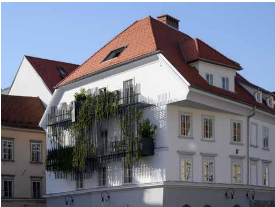
Slika št. 6: Zlata ladjica po obnovi.

zelo deformirana pa je bila oblika banjastega oboka, je bil obok še pravočasno odstranjen (to je še pred izvedbo lahkega nasutja, inštalacij in plošče) in na novo pozidan s polno opeko starega formata (slika št. 10).