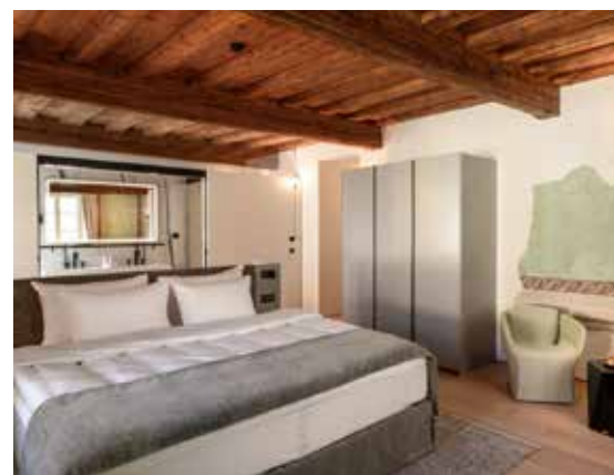
Slika št. 8: Pogled na apartma; vidni obnovljeni (nekoč) primarni leseni nosilci s sekundarnimi stropniki, na desni strani vidna stara poslikava ometa – ometi višjih etaž so večinoma novi s spomeniško sestavo in strukturo, delno so poslikani z replikami ali pa so restavrirani dovolj dobro ohranjeni deli starih notranjih ometov.

Izkopi za nove kletne prostore in poglabitev obstoječe kleti so se izvajali postopno