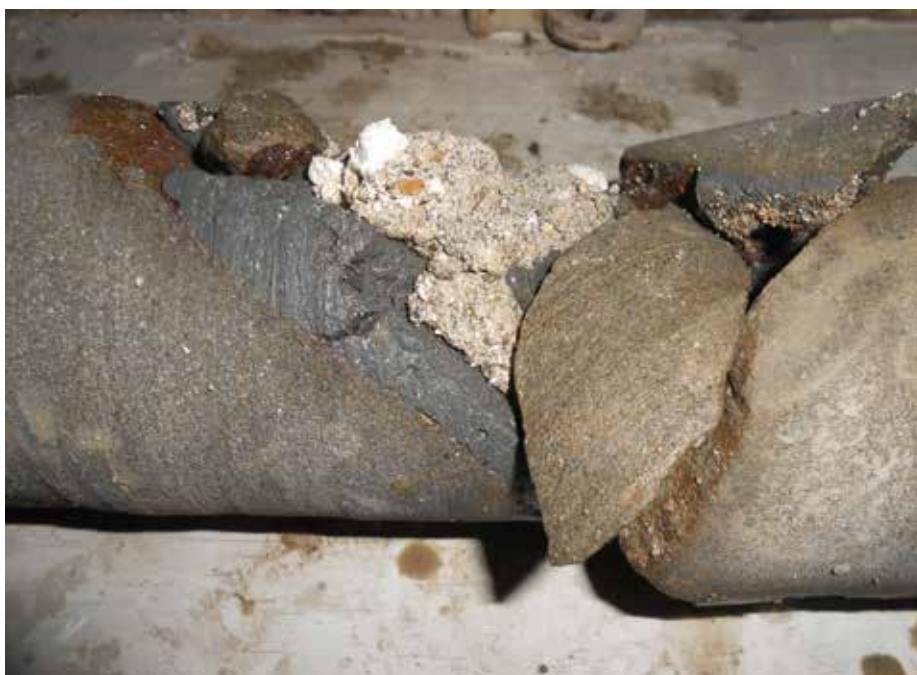
Slika št. 4: Detajl odvzetega kontrolnega valja z vidno injekcijsko maso (temno sive barve) v prostoru med kamnitim gradivom in staro malto.

Šele v fazi obnove spodnjega ometa se je izkazalo, da je opeka enega oboka zelo dotrajana. Glede na fazo ostalih del ni bilo več mogoče storiti drugega kot problematični obok na nekaj segmentih spodnje ploskve utrditi z v obok sidrano armaturo in betonsko reprofilacijo. V primeru drugega oboka, kjer je bila sicer opeka v dobrem stanju,