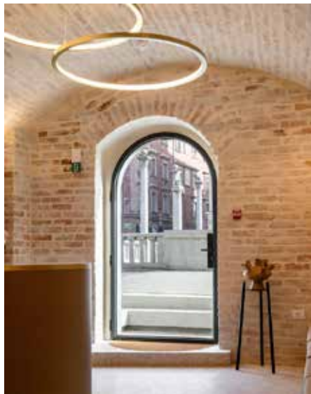
Slika št. 10: Pogled iz smeri recepcije proti hotelskemu vhodu; viden na novo pozidan obok in opečni zidovi s »prosojnim« ometom ter teraco tlak.

Vse stare lesene medetažne konstrukcije s primarnimi lesenimi nosilci in sekundarnimi stropniki so bile obnovljene skladno z zahtevami restavratorske stroke. Del najbolj dotrajanih stropnih elementov je bil nadomeščen s podobnimi, približno enako starimi iz drugega objekta, kjer lesenih