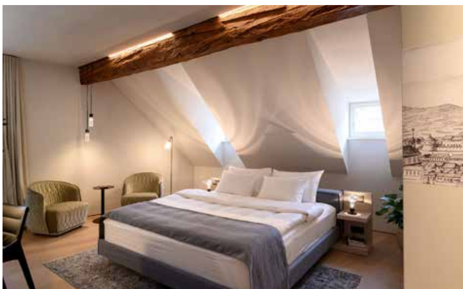
Slika št. 9: Pogled na mansardni apartma, viden več stoletij star sestavljen lesen nosilec s tesarskim strižnim stikom in kovinskimi veznimi sredstvi.