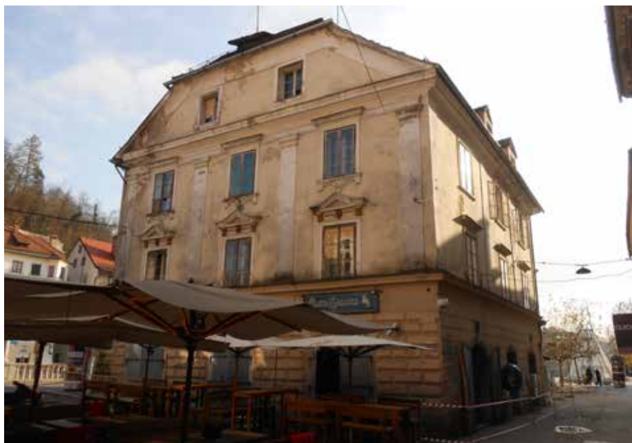
Slika 2: Zlata ladjica je bila pred prenavo v zelo slabem stanju.

V hotelskih prostorih, ki so bili na novo urejeni v nadstropjih, imajo luksuzni apartmaji