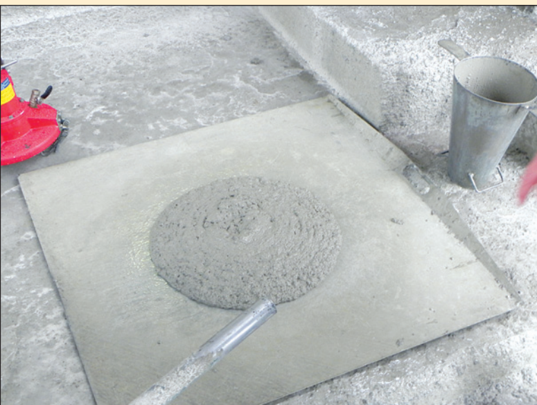
Preverjanje konsistence samozgoščevalnega podlivnega betona na gradbišču v predoru Križiški

tona do mesta vgradnje smo ugotavljali na podlagi podatkov na dobavnicah. Kontrolirali smo številko naročenega betona in čas od zamešanja svežega betona do transporta na mesto vgradnje. Konsistenco na gradbišču smo preverjali po t.i. »slump testu« z obrnjenim stožcem, iz katerega se betonska mešanica razleže po podlagi, na kateri se izmeri premer razleženega betona (slika 4). Za vsa odstopanja od zahtevane konsistence smo predvideli korekcijske ukrepe z dodajanjem zamesne vode v količini do 5 l/m 3 betona in/ali z dodajanjem superplastifikatorja oz. hiperplastifikatorja na gradbišču po navodilih proizvajalca oz. betonarne. Beton je bil vgrajen v konstrukcijo, ko je izpolnjeval vse predvidene zahteve pred ali po izvedenih korekcijskih ukrepih.