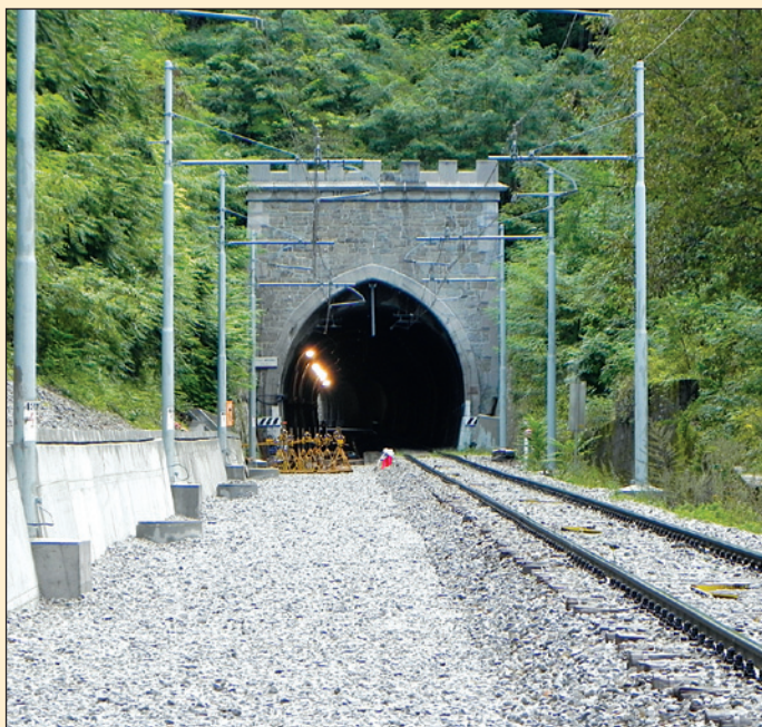
Predor Križiški

P ri sanaciji predora Križiški v dolžini 325 m na odseka proge Košana-Gornje Ležeče od km 654+185 do km 656+866 je Gradbeni inštitut ZRMK d.o.o. izdelal projekt betona in izvajal notranjo kontrolo kakovosti betonerskih del (slika 1). Izvajalec gradbenih del je bil SŽ - ŽGP d.o.o. Sanacija je predvidena v dveh fazah. Prva faza je bila sanacija celotnega desnega tira omenjene proge, ki je predmet tega prispevka.