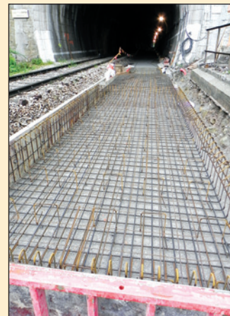
ÖBB-PORR plošče po vgradnji v predoru Križiški in betonska plošča (vir ZRMK)

analiza vode je pokazala, da voda ne deluje agresivno na beton, kar je bil razlog, da stopnje izpostavljenosti XA1 pri določanju projektiranih lastnosti nismo upoštevali. Beton je izpolnjeval vse zahteve iz slovenskega standarda SIST EN 206-1 s projektiranimi lastnostmi: C30/37, XC4, XD2, XF3, Dmax 16, s ciljnimi razlezom 700 mm v proizvodnem obratu in s ciljnimi razlezom 600 mm na gradbišču. Podlivni beton z oznako L-26-HP-EX smo projektirali z razpoložljivimi kemijskimi dodatki in z mineralnim ekspanzivnim dodatkom na naslednji način: