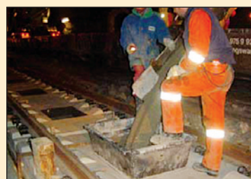
Vgrajevanje samozgoščevalnega podlivnega betona na gradbišču v predoru Križiški