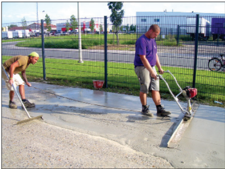
Primer obdelave vozne površine s tankoslojno visokotrdno vodonepropustno kompozitno malto z visoko energijsko loma »Rapitec pva pavk«.

in visokih objektov, npr. v Združenih arabskih emiratih, kjer je bil uporabljen beton s tlačno trdnostjo 80 MPa.