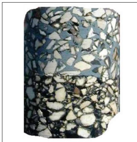
Primer mikrostrukture asfaltnega betona, zapolnjenega s posebno zalivno mineralno maso Microbeton Asphalt grout.