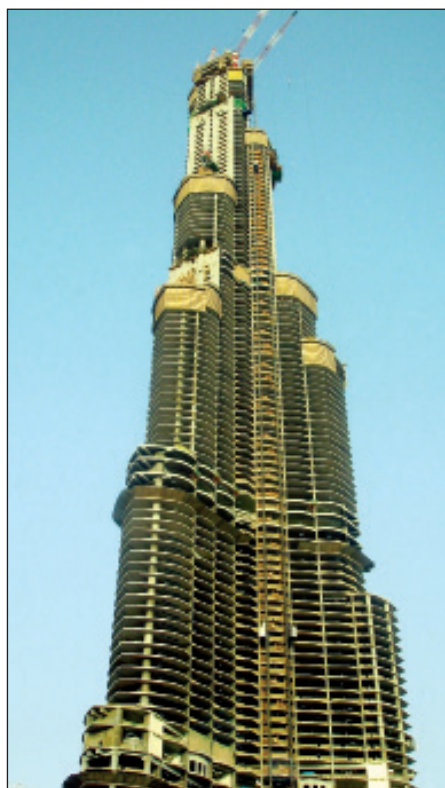
Posebni kemijski dodatki novih generacij v kombinaciji z mineralnimi dodatki omogočili gradnjo zelo zahtevnih armiranobetonskih inženirskih in visokih objektov, kot je najvišja zgradba na svetu Burj Khalifa v Dubaju.

V zadnjih letih se tako za podaljšanje življenjske dobe kot za popravila horizontalnih betonskih površin uporabljajo t.i. kompozitne preplastitve, ki so kombi-